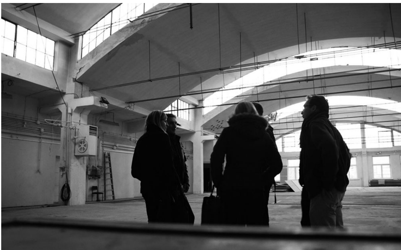
Fot. 2. Hala przyszłego Centrum Sztuki Współczesnej.