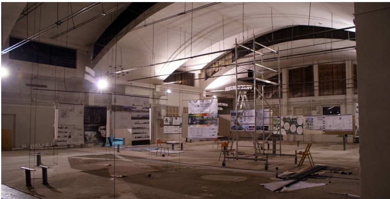
Fot. 1. Hala przyszłego Centrum Sztuki Współczesnej.