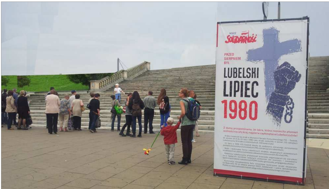
Symulacja – Widok od pl. Zamkowego na wprost przez przejścia dla pieszych w kierunku hali Nova

Pozostawienie trasy W-Z oraz Podzamcza na jego obecnym poziomie (z możliwą korektą trasowania jezdnii), daje następujące korzyści: