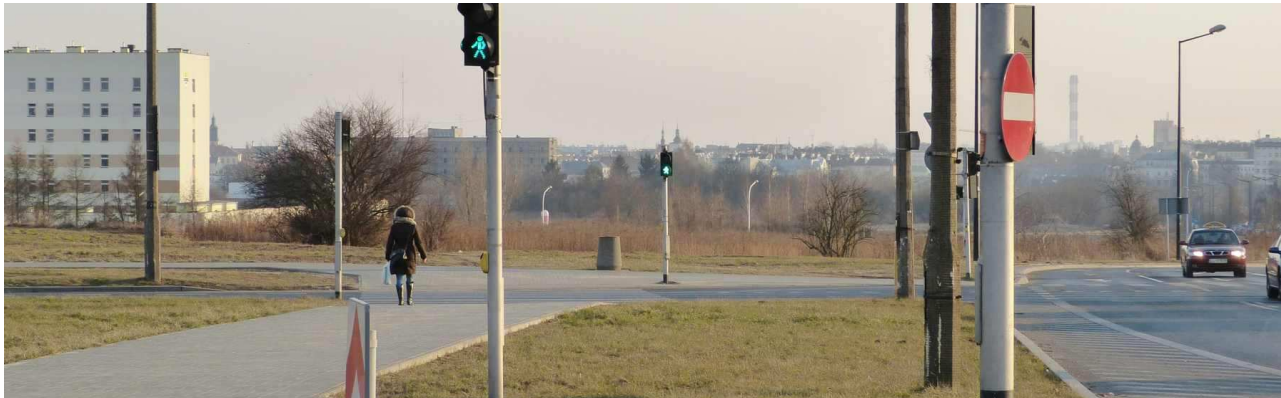
Spod siedziby TP S.A. widać tylko panoramę Śródmieścia miasta i częściowo wieżę ratusza.

Analiza stanu obecnego. Należy przyznać, że będące przedmiotem Pańskiej troski widoki objęte ochroną w ramach wspomnianych przez Pana Stref zostały już znacząco zdegradowane. Zostały one częściowo zastąpione przez budynki Komendy Policji i Szpitala Dziecięcego, co widać na poniższych fotografiach: