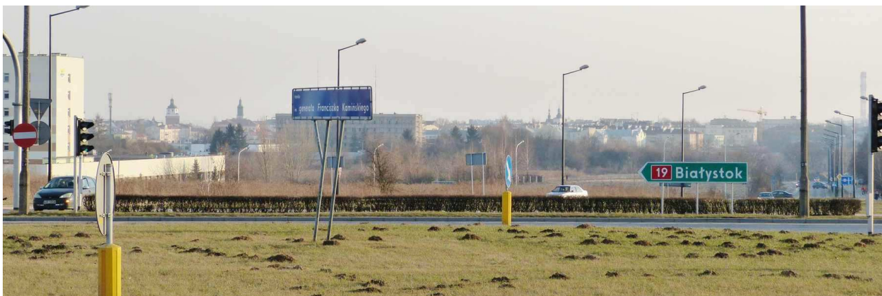
Przechodząc przez jezdnię na zachód w „oknie” między Szpitalem i Komendą pojawiają się wieże Ratusza i Bramy Krakowskiej.