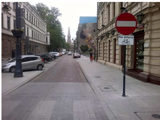
Łódź, ul. Roosevelta