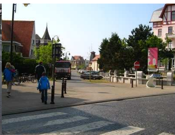
De Haan, Belgia