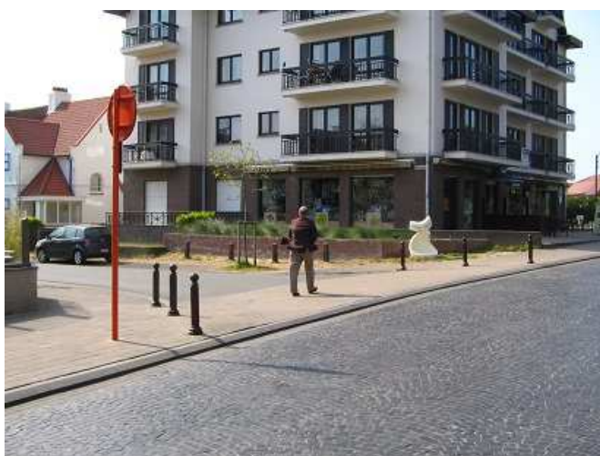
De Haan, Belgia