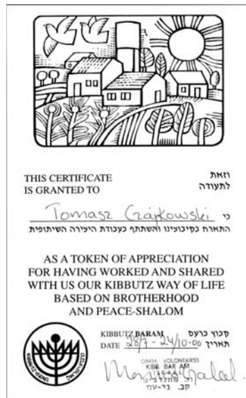
Certyfikat Bar Am.

Do środka kibucu dostać się można główną bramą, pilnowaną przez uzbrojonych żołnierzy. Otwierają ją i zamykają każdorazowo za przejeżdżającym pojazdem, sprawdzając jego pasażerów bez względu na to, czy jest to samochód kibucowy, dostawczy zaopatrujący kibuc w żywność, czy, tak jak w moim przypadku, autobus kursujący na trasie Hajfa–Bar Am. Istotnym punktem obrony kibucu mogą być domy położone strategicznie na skarpie powyżej drogi prowadzącej w głąb osiedla. Mieszkają tam osoby powołane do odbywania służby wojskowej, a więc uzbrojone. W nocy