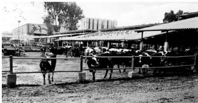
Kibucowe krowy. Kibuc Yakum.