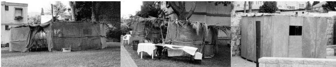
Namioty kuczkowe.

To właśnie wspólna praca jest kwintesencją kibucu.